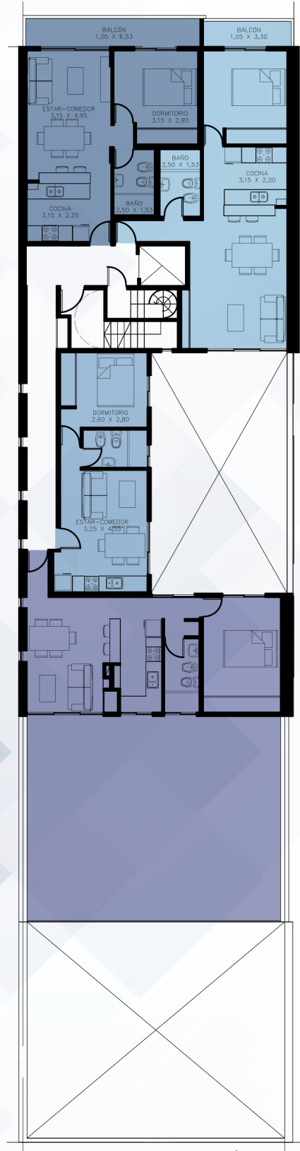
PLANTA 4º PISO