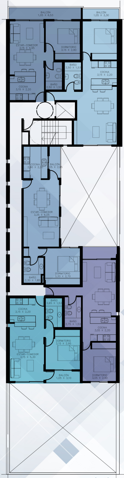
PLANTA 2º - 3º PISO