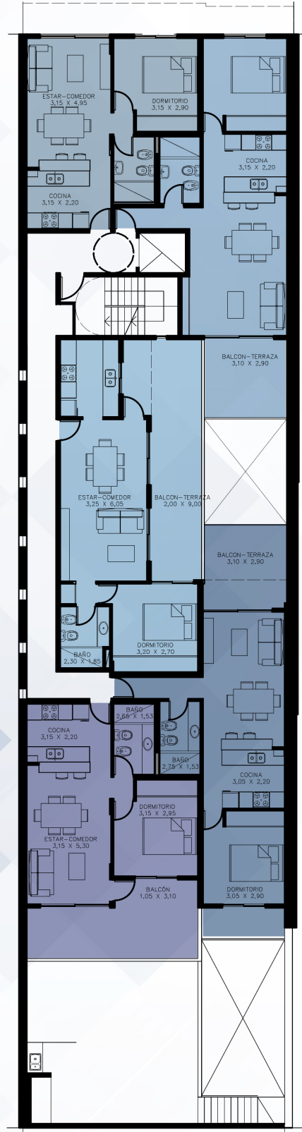
PLANTA 1º PISO